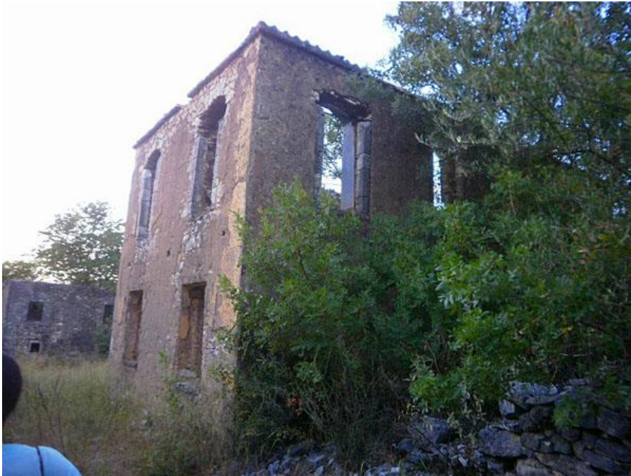
Άποψη του Καρτερίου 2012

Διώροφα κτίρια στο παλιό Καρτέρι, τα οποία συναντάμε σε όλα τα χωριά της Θεσπρωτίας.