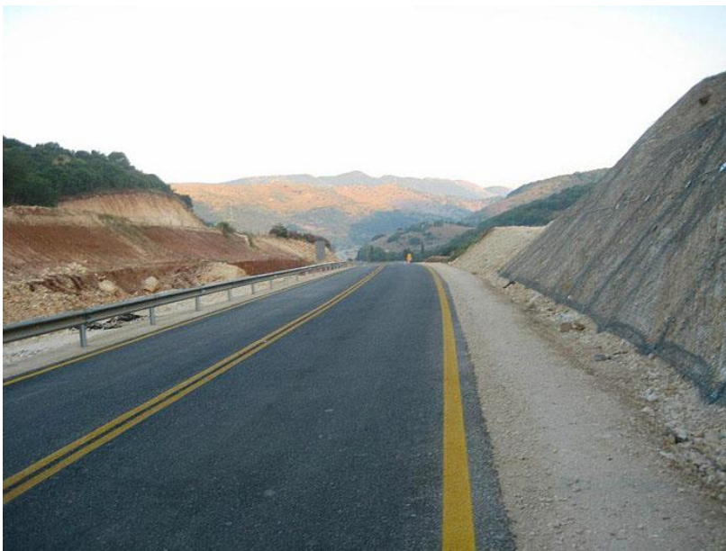
Ο νέος δρόμος στον Άη Δημήτρη και στο βάθος το Μαργαρίτι.