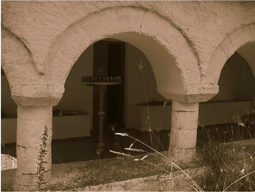
Η διάνοιξη του οδικού δικτύου στο Καρτέρι 2012.